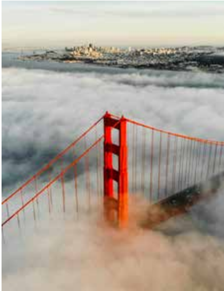
← Golden Gate v San Franciscu .